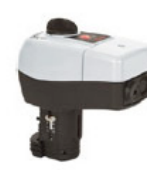
VALVULA DE 2 1/2" A 6"