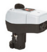
ACTUADOR PARA VÁLVULA HASTA 3"