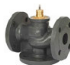
VÁLVULA DE 2 1/2" A 6"