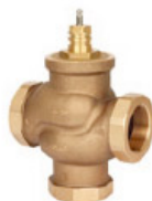
VÁLVULA HASTA 2"